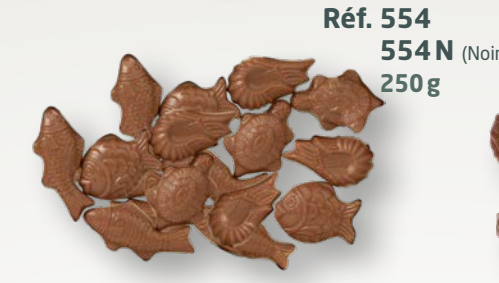
Réf. 554 554N (Noir) 250g