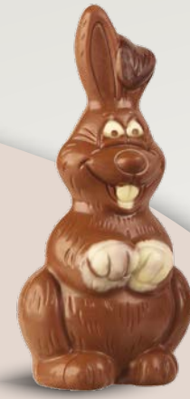
Réf. 521 12 cm - 50 g