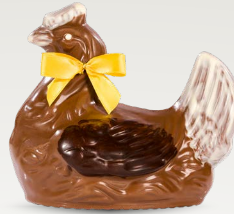
Réf. 506 506B (Blanc) 506N (Noir) 15 cm - 230 g