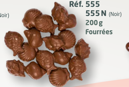
Réf. 555 555N (Noir) 200g Fourrées