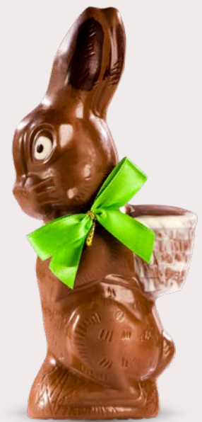
Réf. 510 21 cm - 150 g