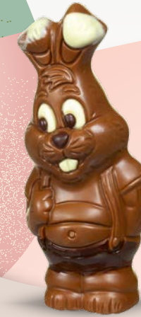
Réf. 518 13 cm - 70 g