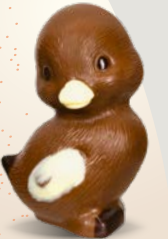
Réf. 520 4 cm - 60 g