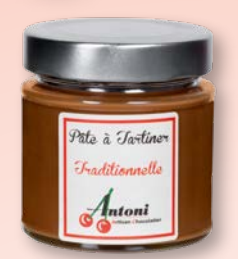
Traditionnelle Réf. 61 - 200g 62 - 800g