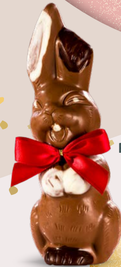
Réf. 515 515B (Blanc) 515N (Noir) 17 cm - 100 g