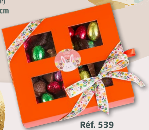
Réf. 539 14 x 14 cm 300g