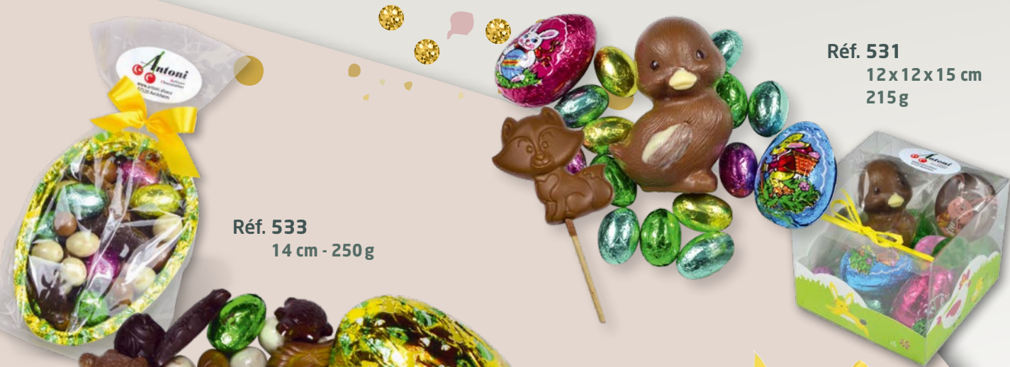
Réf. 533 14 cm - 250g