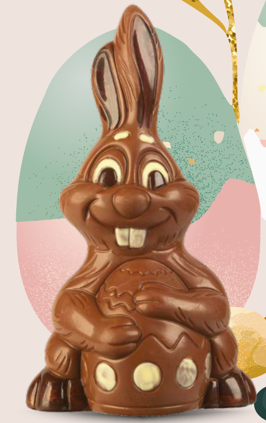
Réf. 504 23 cm - 240g