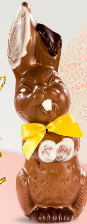
Réf. 507 26 cm - 220 g