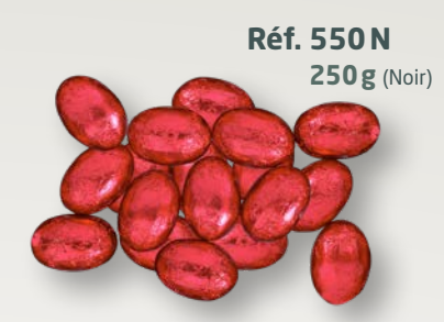
Réf. 550N 250g (Noir)