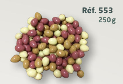
Réf. 553 250g