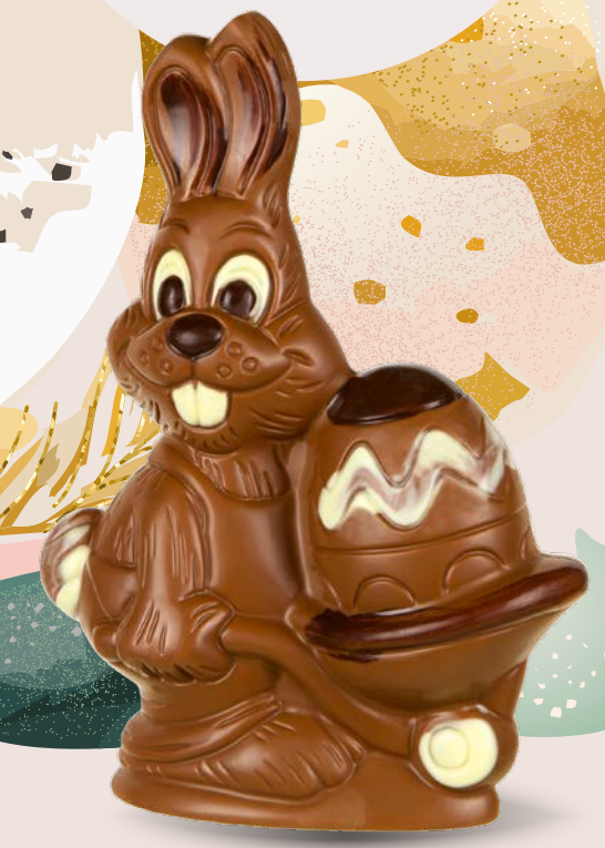
Réf. 505 21 cm - 240g