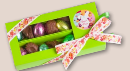
Réf. 538 538N (Noir) 7,4 x 15,5 cm 130g