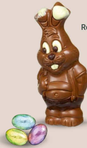
Réf. 530 13 cm - 95 g