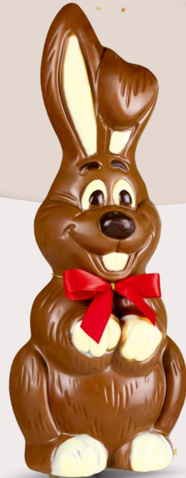
Réf. 502 502B (Blanc) 502N (Noir) 30 cm - 350 g