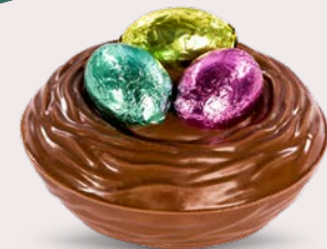
Réf. 517 Ø 8 cm - 75 g