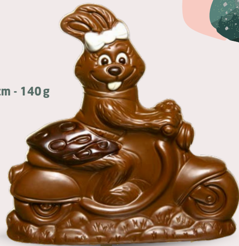
Réf. 513 14,5 cm - 140 g