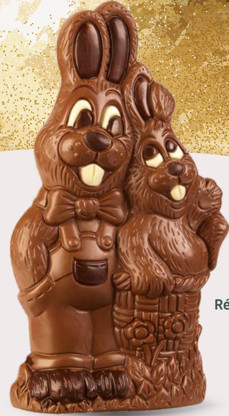
Réf. 503 22 cm - 250 g