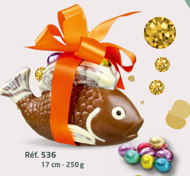
Réf. 536 17 cm - 250g