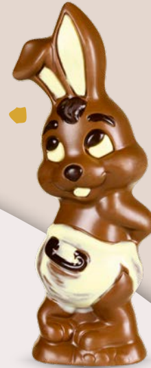
Réf. 514 514B (Blanc) 514N (Noir) 17 cm - 100 g