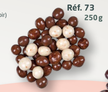
Réf. 73 250g