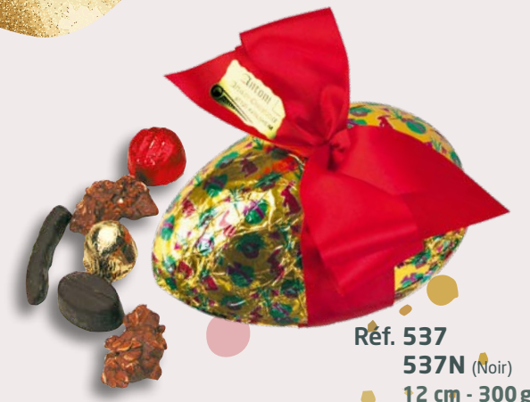
Réf. 537 537N (Noir) 12 cm - 300g