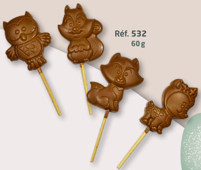
Réf. 532 60g