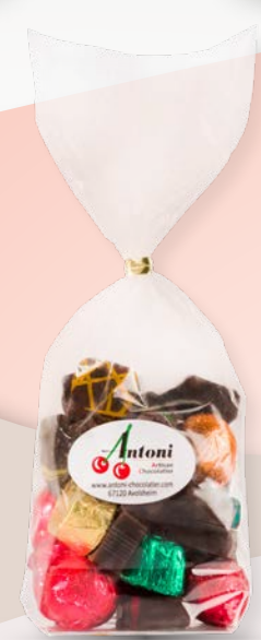
Réf. 17 250g