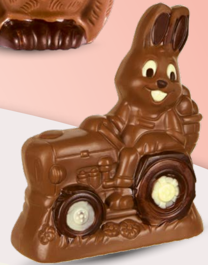
Réf. 508 508B (Blanc) 508N (Noir) 15,5 cm - 160 g