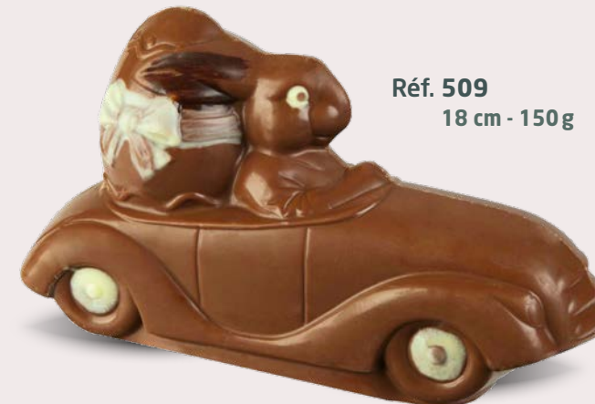
Réf. 509 18 cm - 150 g