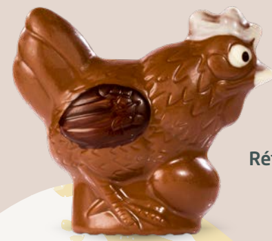
Réf. 519 10 cm - 60 g