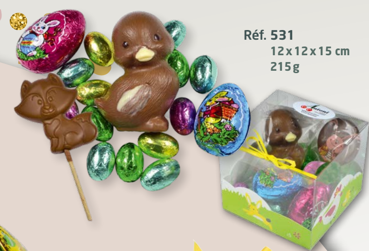
Réf. 531 12x12x15 cm 215g