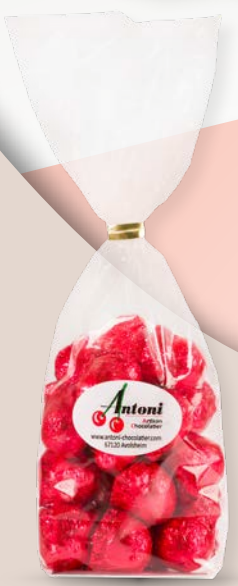
Réf. 14 250g