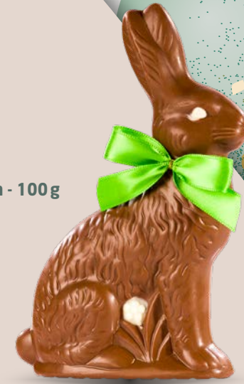
Réf. 516 16 cm - 100 g