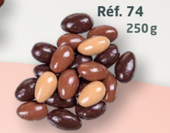
Réf. 74 250g