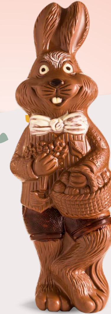
Réf. 501 501B (Blanc) 501N (Noir) 35 cm - 440 g