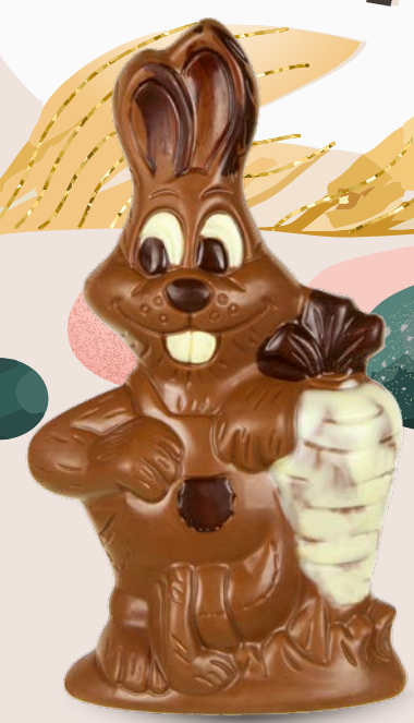
Réf. 512 512B 512N 18,5 cm - 140g