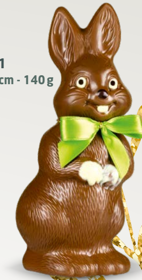
Réf. 511 19 cm - 140 g