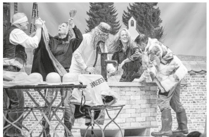
Die große Wasserschlacht am Brunnen.