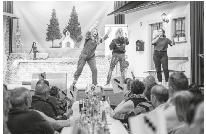
Die Feuerwehrabteilung Heiligenberg beim Brainstorming

Ihr Wintersulger Dorftheater Berthold Schreiber