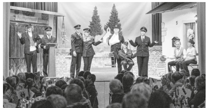
Unser Schluss des Stückes: "Aller guten Dinge sind drei".